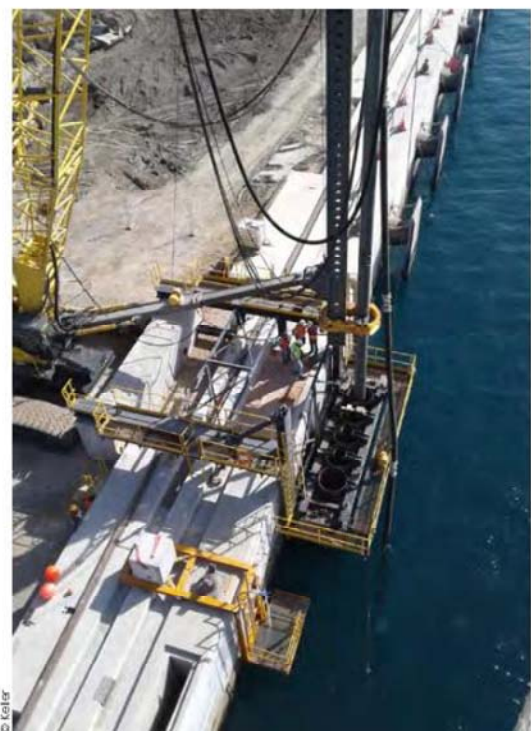
Vue de l'atelier de forage.

Le marché comprenait la définition et la réalisation d'une campagne de reconnaissance complémentaire destinée à établir la note d'hypothèses géotechniques à prendre en compte dans les justifications de stabilité du rideau de soutènement. Les sondages, essais et prélèvements ont été réalisés en pied de quai, depuis une plateforme autoélevatrice au droit du futur soutènement. Cette campagne a permis de valider, après de nombreux calculs et simulations